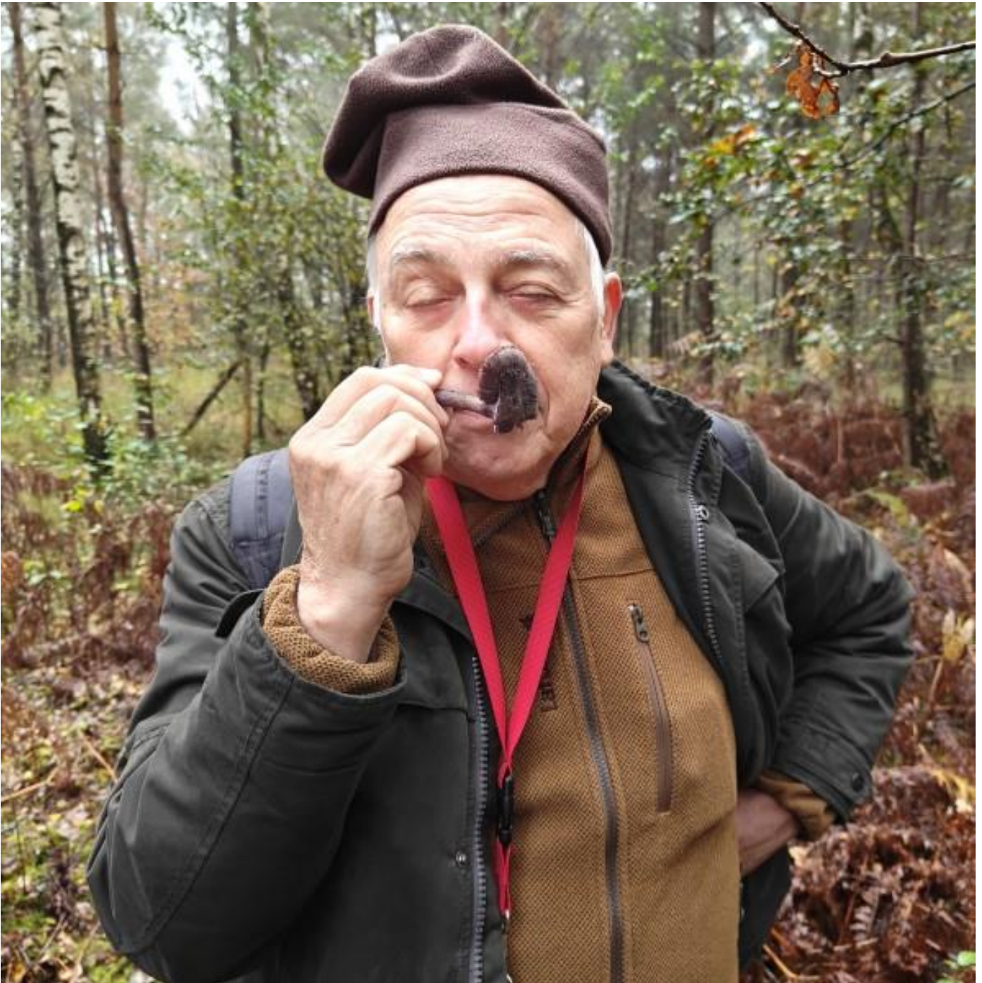
Het genot van de Slobkous